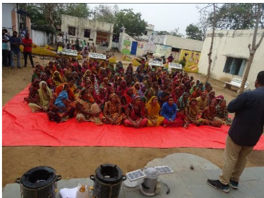
Awareness on Renewable Energy Technologies

Technology Transfer and Extension Division: SPRERI actively promotes renewable energy technologies through field demonstrations, training programs, and entrepreneurship development initiatives by the division. The division also utilizes the CSR fund of associated industries by implementing Renewable Energy Technologies to improve the life of weaker sections and creating an eco-friendly working environment. Additionally, the institute contributes to societal welfare through awareness programs and integrated development projects focused on rural villages.