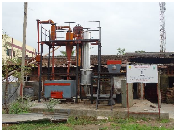
Fluidized Bed Gasification at Poha Industry(100kg/h)

of Social Sciences (TISS) reflects its commitment to interdisciplinary collaboration and broader societal impact. The Institute is financially supported by ICAR, DBT, DST and MNRE Govt of India and also by Department of Energy and Petro-chemicals, GSBTM, GEDA, and GUJCOST of Govt of Gujrat.