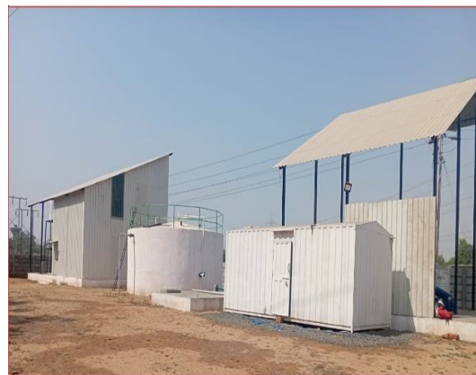
Biogas plant installed at Karamsad (3.5Tonnes per day)