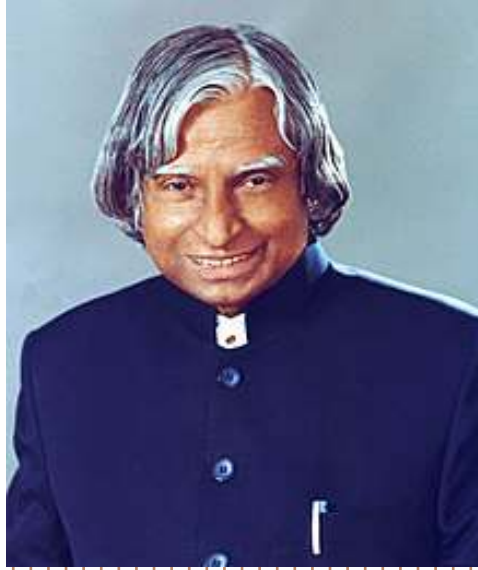
Avul Pakir Jainulabdeen Abdu Kalam

Postal Regd. No. AND/318/2021-23 RNI Regd. No. Guj/2009-11/5433 Posted at Vallabh Vidyanagar on 5 th of Every Month