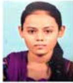
સિમરાંબાનુ કિરન કિરન