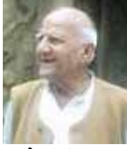
૧૯ ફેબ્રુઆરી, ૧૯૨૨ ૨૪ ઓક્ટોબર, ૨૦૦૬