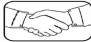
Direct (Individual Sanitation)