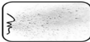
Airbourne (Ambience Treatment)