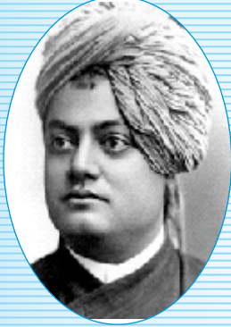
Swami Vivekananda (12.01.1863 -04.07.1902)