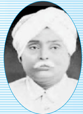
Lala Lajpat Rai (28.01.1865-17.11.1928)