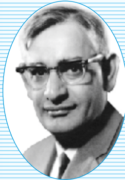
Dr. Har Gobind Khorana (09.01.1922-09.11.2011)