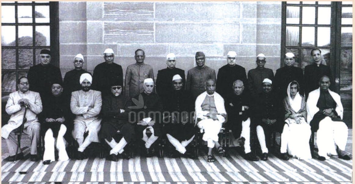
The cabinet of India on 31 January 1950 , along with the newly appointed President Rajendra Prasad. (L to R sitting) Dr. B.R. Ambedkar, Rafi Ahmed Kidwai, Sardar Baldev Singh, Maulana Abul Kalam Azad, Jawaharlal Nehru, Dr. Rajendra Prasad, Sardar Patel, Dr. John Mathai, Shri Jagjivan Ram, Rajkumari Amrit Kaur and Dr. S. P. Mukherjee. (L to R standing) Khurshed Lal, R.R. Diwakar, Mohanlal Saksena, N. Gopaldaswami Ayyangar, N.V. Gadgil, K. C. Neogy, Jairamdas Daulatram, K. Santhanam, Satya Narayan Sinha and Dr. B. V. Keskar.