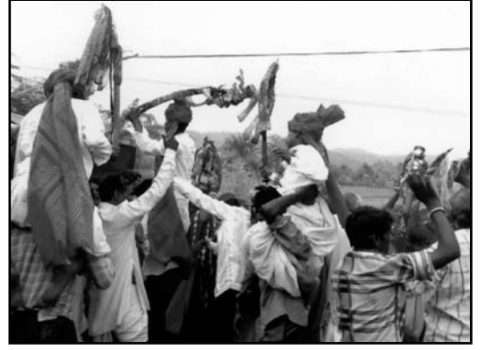
વર રાજાઓને ન્યાવતા સંબંધીઓ

જાન કન્યાના ગામને ગાંદરે રોકવામાં આવે છે. અને કન્યા પક્ષના ગામના આગેવાનોના આદેશ પ્રમાણે જાન કન્યાના ઘર સુધી જાય છે. અહીં નોંધપાત્ર બાબત એ છે કે કન્યા પક્ષનો આદેશ ન મળે અને જાન કન્યાના ઘર પાસે લઈ જવામાં આવે તો કન્યા પક્ષના આગેવાનો દ્વારા દંડ લેવામાં આવે છે.