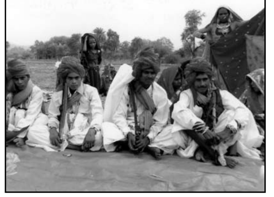
સમૂહ લગ્નમાં ઉતારે બેઠેલા વરરાજાઓ

તો પણ લગ્ન કર્યા વગર પણ પતિ-પત્ની સહજીવન જીવી શકે છે. તે અમારા ડુંગરી ગરાસિયાનો શબ્દ છે. ૨