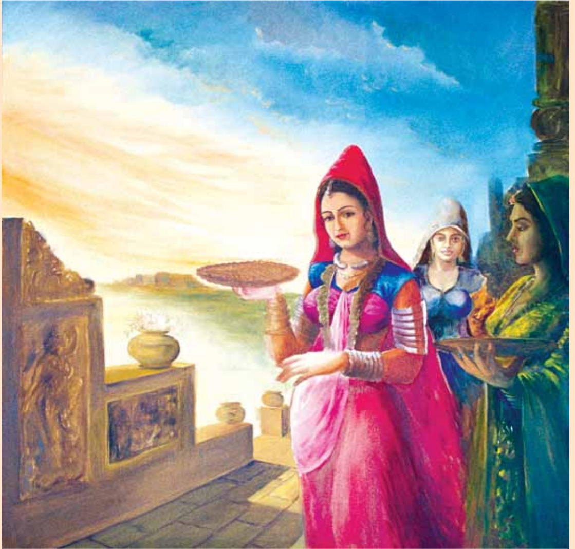
Oil on Canvas