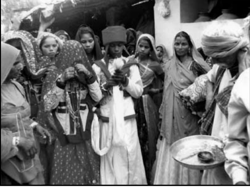
વર-કન્યાને કંકુ ચાંદલો કરી વાંદતા વડીલ