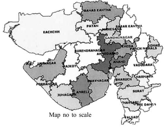
Map no to scale

૧૯૬૦માં નવનિર્મિત ગુજરાત રાજ્યમાં ૧૭ જિલ્લાઓનો સમાવેશ થતો હતો. ત્યારબાદ ઈ.સ. ૧૯૬૪માં અમદાવાદ જિલ્લા તથા મહેસાણા જિલ્લાના કેટલાક ભાગો એકત્ર કરીને પાટનગર ગાંધીનગર જિલ્લાની રચના થઈ. ઈ.સ. ૧૯૬૬માં સુરત જિલ્લામાંથી વિભાજન બાદ વલસાડ નવો જિલ્લો બન્યો. શ્રી શંકરસિંહ વાઘેલાના મુખ્યમંત્રીકાળ